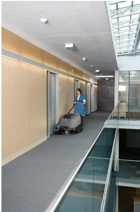
KM 75/40 W Bp Pack