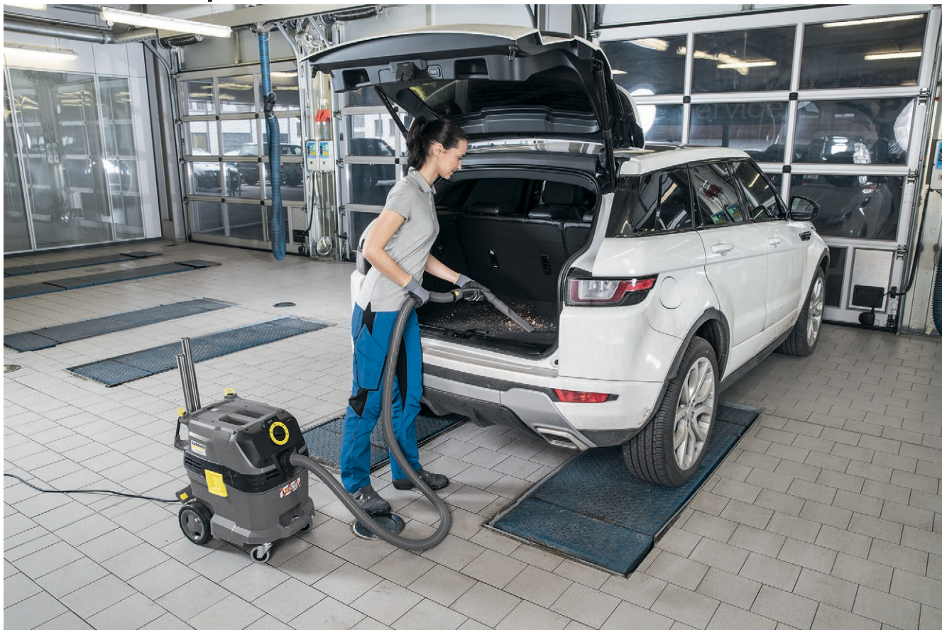
NT 30/1 Tact L