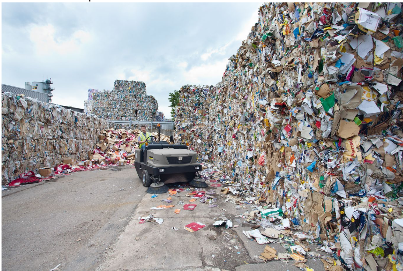
KM 170/600 R D

■ Высокая рабочая скорость и скорость транспортировки