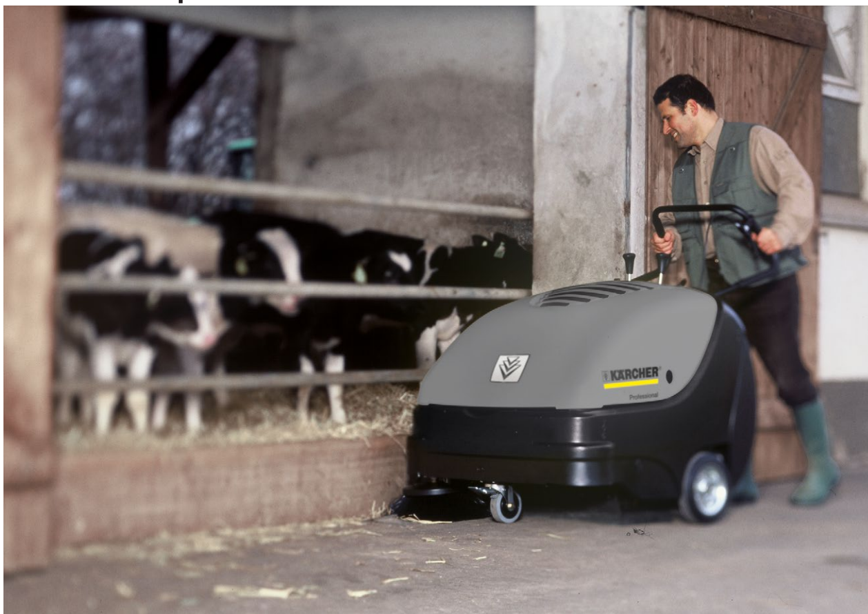
KM 85/50 W G