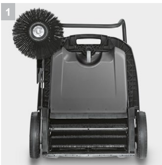
1 Привод основной щеточной головки

Ручная подметальная машина KM 70/20 C 2SB с двухсторонним металлическим приводом - для одинаково эффективного подметания по левой и по правой кривой. Универсальная щетина для чистки в помещении и снаружи. Фильтр для пыли, прочная пластмассовая рама, главный подметальный валик, который легко регулируется, и боковые щетки с плавной регулировкой.