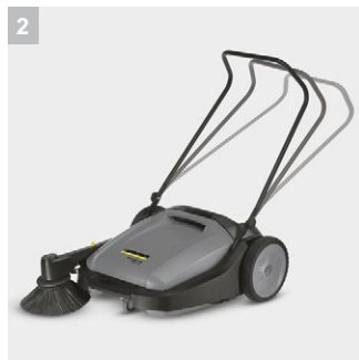
2 Ручка регулируется