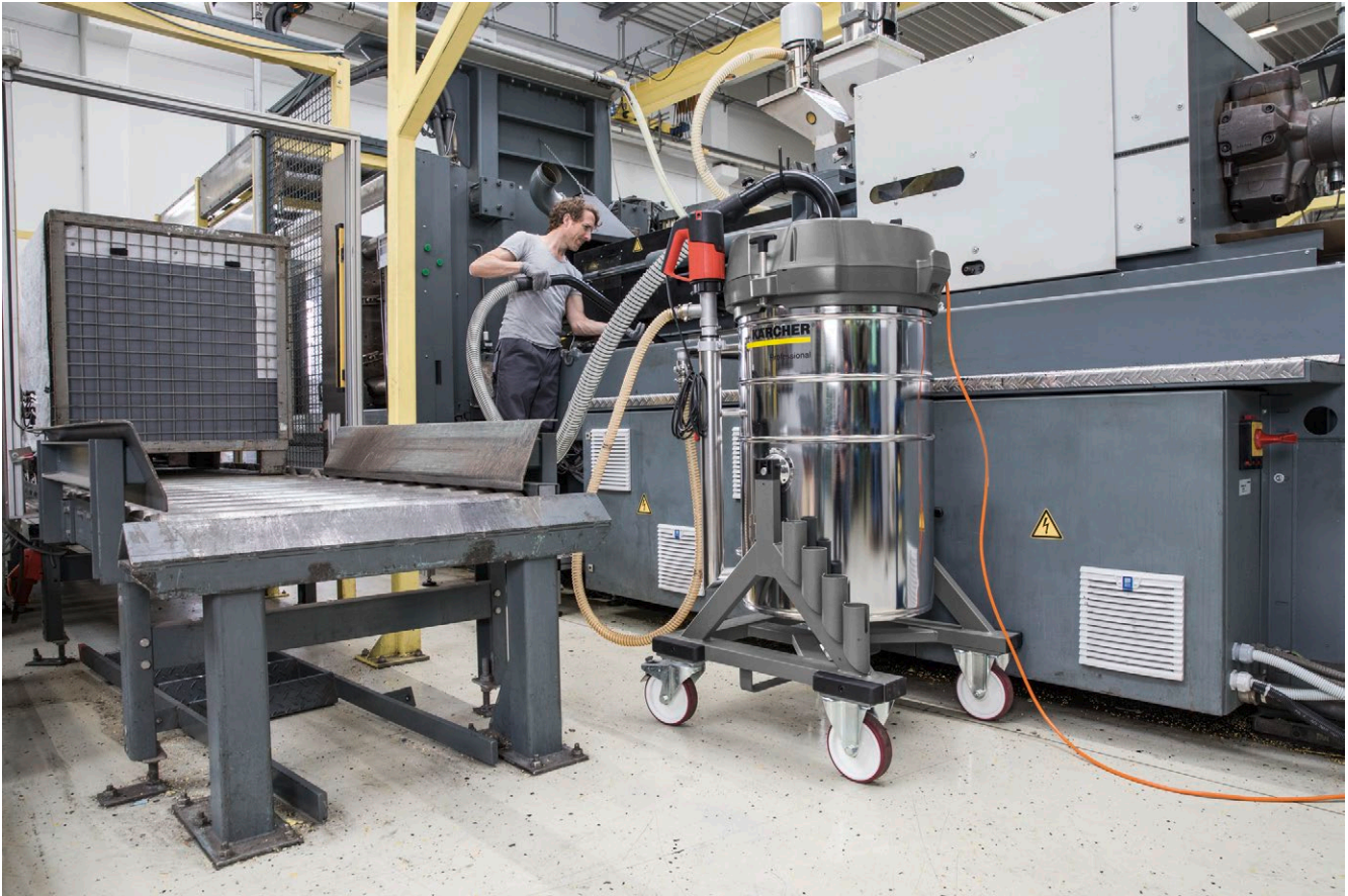
IVR-L 100/24-2 Tc Me Dp