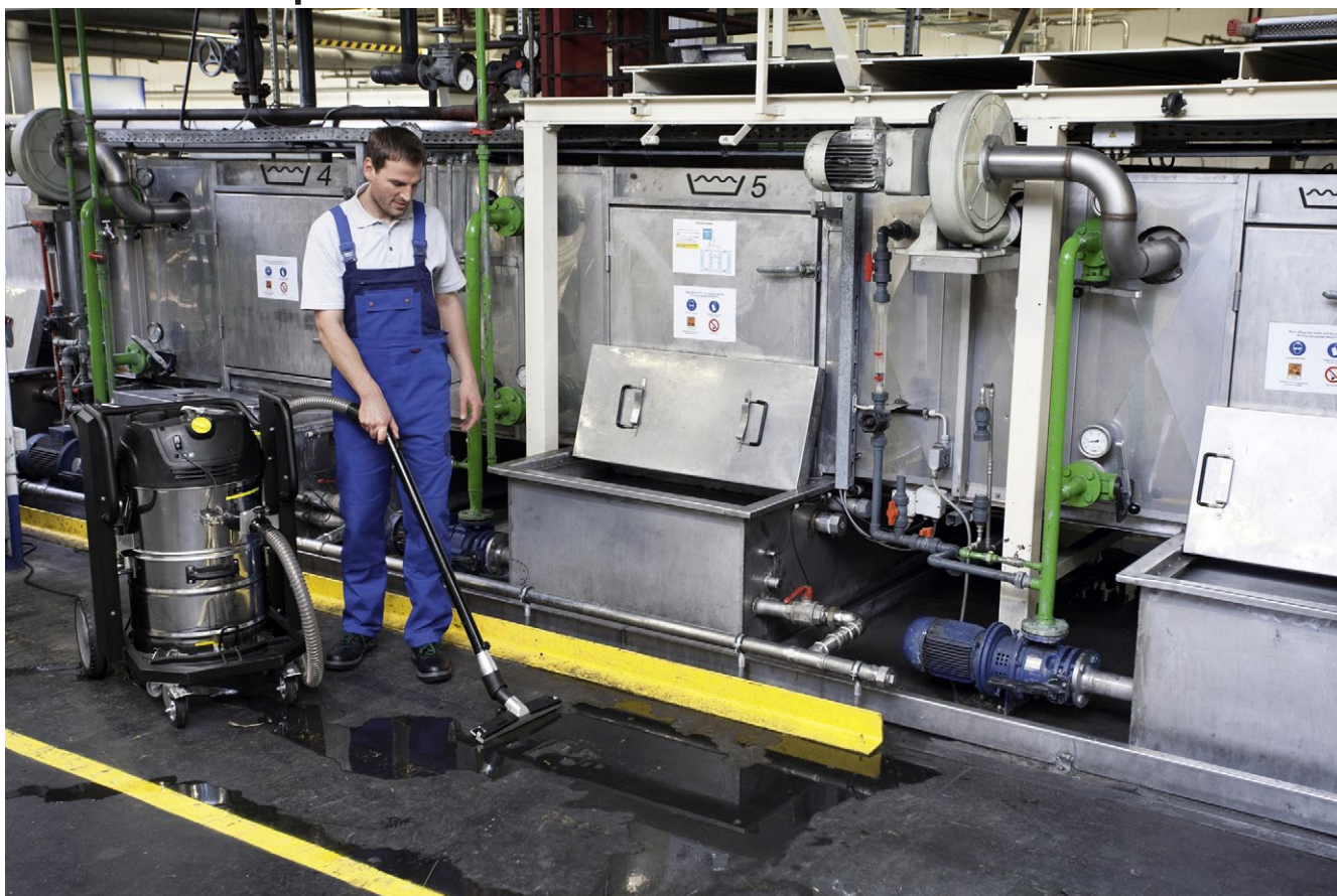
IVC 60/24-2 Tact² M