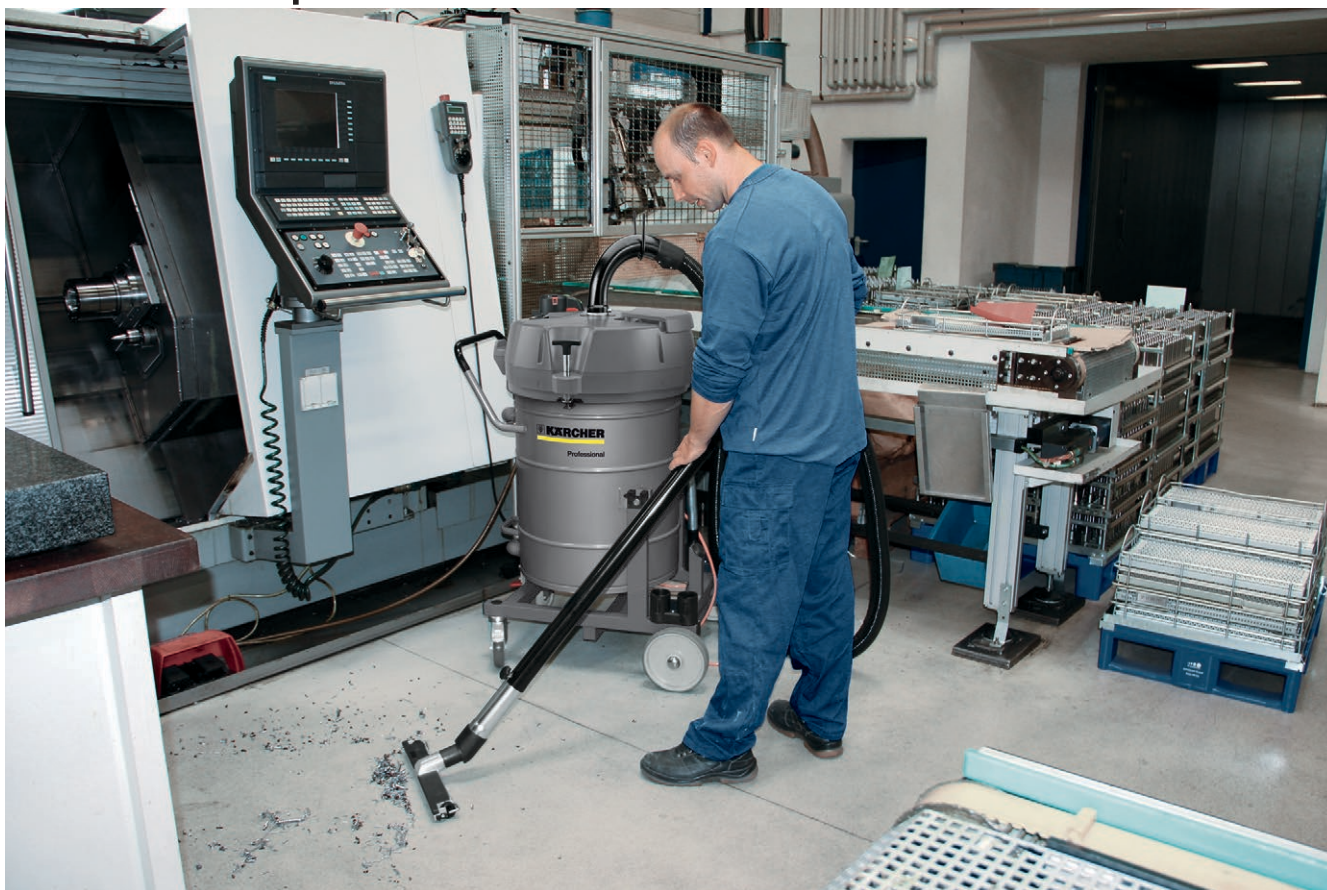
IVR-L 100/24-2 Tc