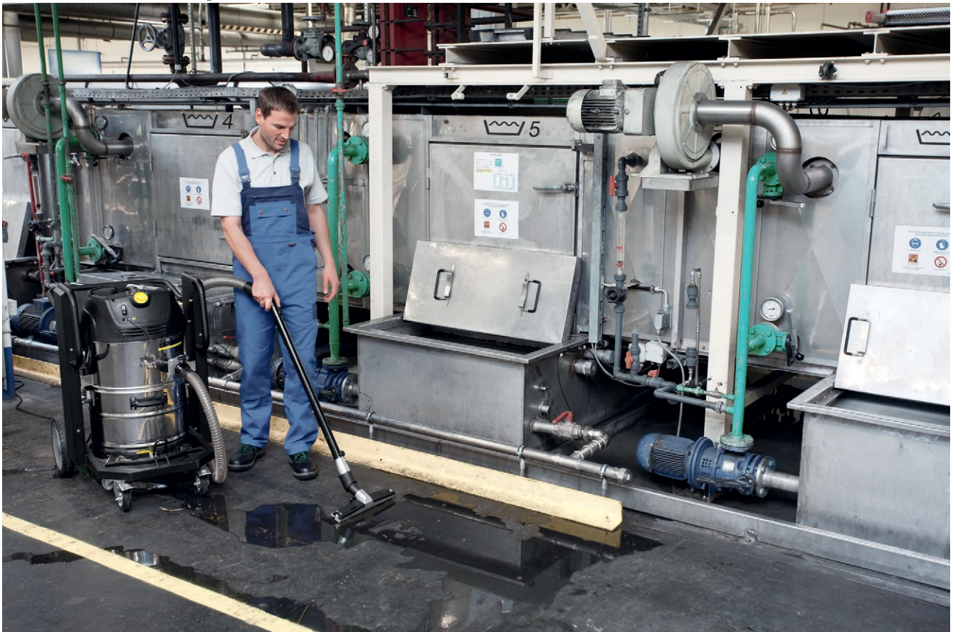
IVC 60/12-1 Tact EC