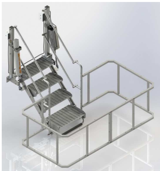
Перекидной мостик сконструирован из металлических труб и профилей оцинкованных горячим способом.